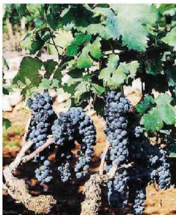
Il tipico alberello del Primitivo

Sono circa 3.140 ettari i vigneti che costituiscono la denominazione del Primitivo di Manduria e 18 i comuni tra Taranto e Brindisi che producono Primitivo di Manduria.